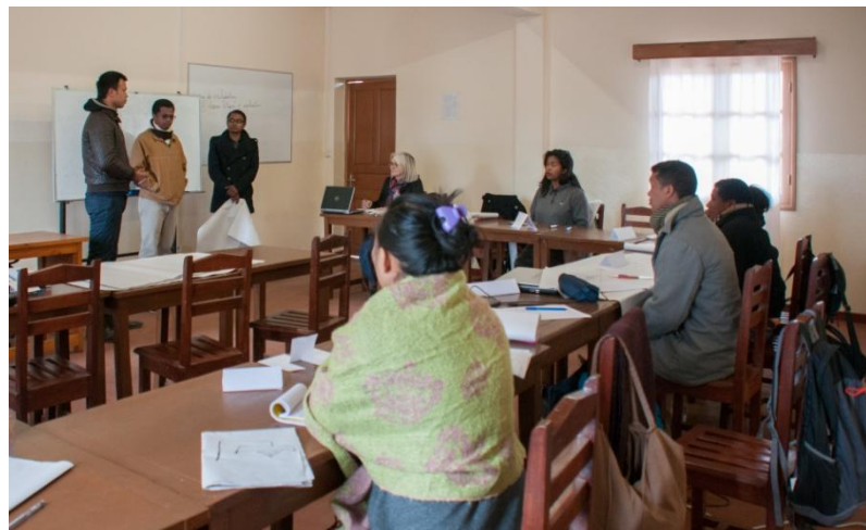
Une classe de Master en juillet, saison froide !

Le bâtiment accueillant la bibliothèque est également terminé et a été aménagé pour cette rentrée scolaire. Il regroupe deux salles informatiques, dont l'une est à rendre opérationnelle, le cyber-café, la bibliothèque et sa salle de lecture, ainsi que différents bureaux pour les responsables de filière et la direction. →