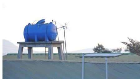
Panneaux solaires, à droite du toit