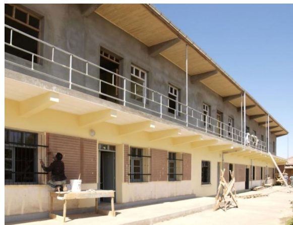
Un étage supplémentaire, notamment au-dessus du réfectoire et de la cuisine, à droite

D'ores et déjà le puits foré est fonctionnel, même si la suite des aménagements reste encore à faire. Une nappe profonde dans des sables grossiers a été atteinte, sous une couverture argileuse et volcanique issue d'éruptions de volcans éteints proches, dont celui de Tritive. La pompe immergée est actionnée à partir de panneaux solaires.