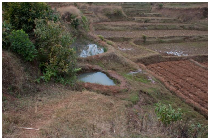
La source où l'école trouve son eau, 500 m. plus loin

l'école. Actuellement une soixantaine d'enfants fréquentent les six classes primaires et secondaires. Beaucoup abandonnent en cours de route faute de revenus des parents pour assurer les écolages. Ce sont les seuls revenus de l'école. Les enseignants sont payés environ 35 francs par mois et ils ne reçoivent pas de salaire durant les vacances. Pour cette année 2018, le Syndicat des enseignants jurassiens (SEJ) a pris en charge les 850 francs que représentaient les salaires des enseignants durant les vacances.