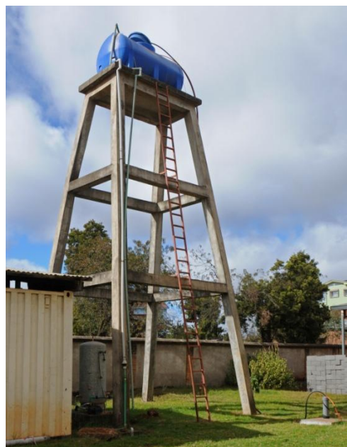
Château d'eau, tête de puits à droite

D'ores et déjà le puits foré est fonctionnel, même si la suite des aménagements reste encore à faire. Une nappe profonde dans des sables grossiers a été atteinte, sous une couverture argileuse et volcanique issue d'éruptions de volcans éteints proches, dont celui de Tritive. La pompe immergée est actionnée à partir de panneaux solaires.