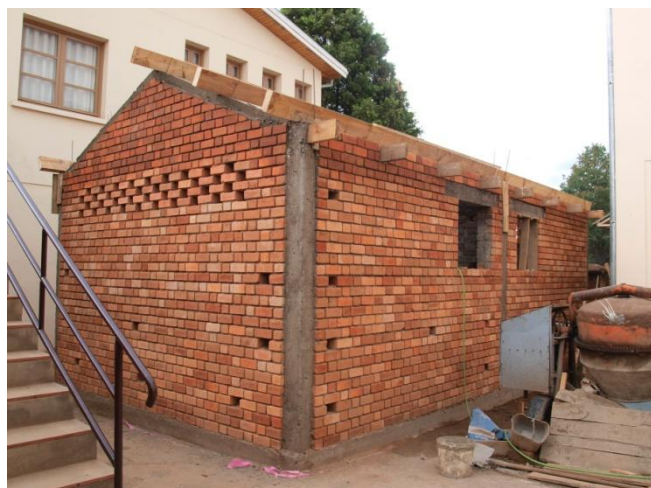
Le bloc sanitaire prend forme