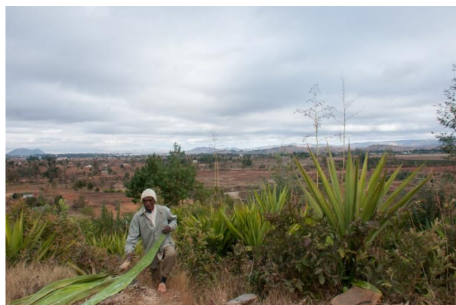
Du sisal, une vue sur la plaine, Antsirabe au fond à droite