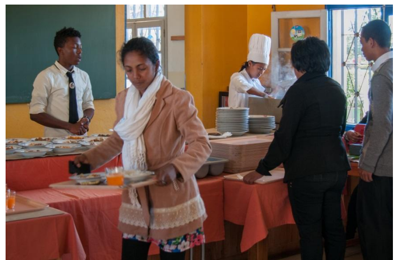
Die Küche wie auch die Mensa ermöglicht es den Studierenden des Lehrgangs „Hotellerie und Restauration“, erste praktische Erfahrungen zu sammeln.