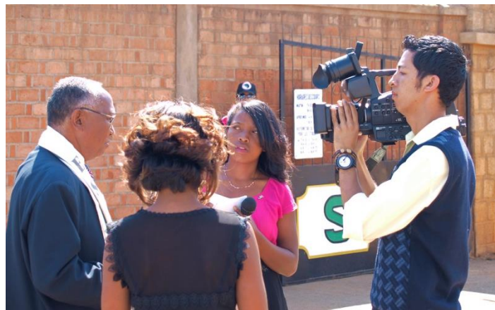
Beim Drehen einer Reportage