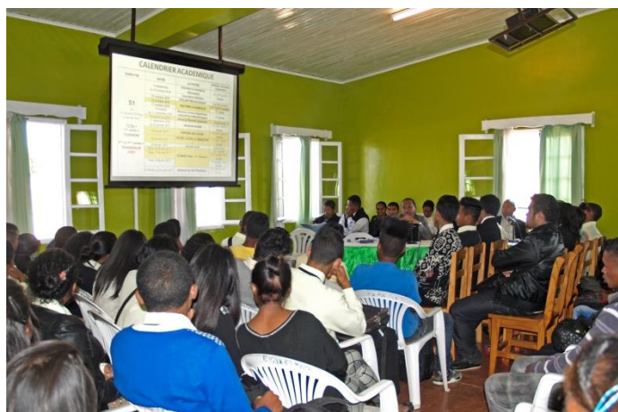
Ein neues Leben im Rhythmus des akademischen Kalenders

Da die Schülerzahl dieses Jahr zugenommen hat, wurden die verfügbaren Plätze begrenzt, um eine Überbelegung zu vermeiden. Die Verantwortlichen hatten mit der Aufnahme von knapp 200 Schülern gerechnet. Schliesslich wurden es über 300, deshalb mussten sie in einigen Lehrgängen die Einschreibungsmöglichkeiten begrenzen. Im Ganzen werden es im Jahr 2016-2017 also 600 Studierende sein.