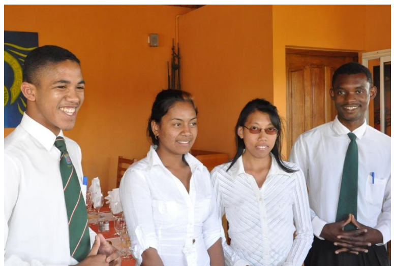
Studierende der Richtung Hotellerie und Gastronomie bereiten sich auf den Jahreskongress der frankophonen Presse vor.