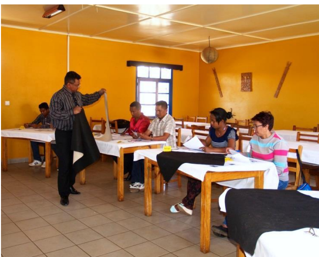
Ausbildung im Bereich Hotellerie an der ESSVA durch den zertifizierten Studienleiter (OIF)

Die Terrasse des „Hotels des Thermes“ im kolonialen Stil. Das Hotel ist bekannt für die Beherbergung des Königs von Marokko Mohammed V mit seinen Angehörigen, inklusive des zukünftigen Königs Hassan II, während des Exils 1955.