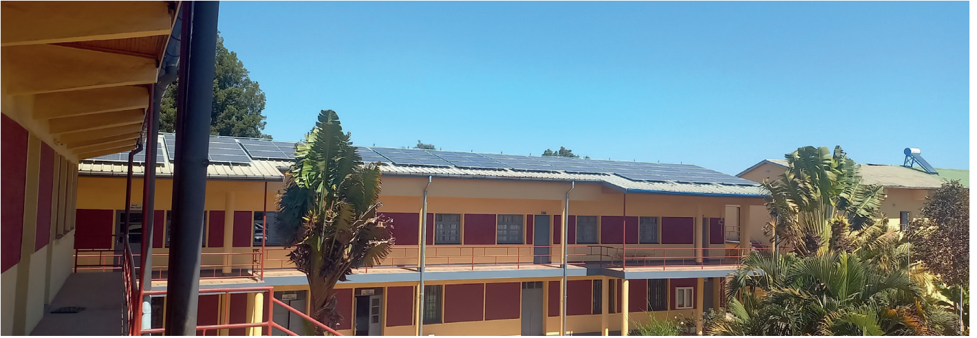
Le bâtiment bibliothèque et administration désormais équipé de panneaux photovoltaïques