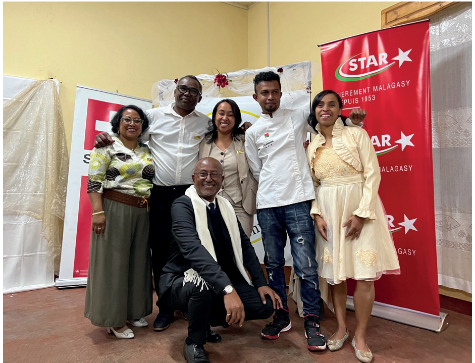
En compagnie du vice-recteur, les responsables de mention de la filière HR lors de la fête de promotion à l'ESSVA

Malgré la situation politique instable, le président et le vice-président se sont