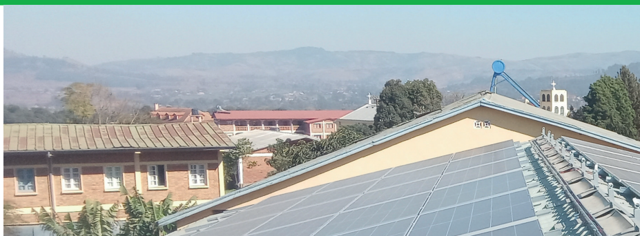
A l'ESSVA, pose de panneaux photovoltaïques pour parer aux nombreuses coupures d'électricité

De son côté, la Fondation Avenir Madagascar a répondu aux revendications de la jeunesse en mettant en place, depuis quelques années déjà, une alimentation en eau pérenne à l'ESSVA par le creusage de forages et la construction d'un château d'eau. Cette année, la production d'électricité par la pose de panneaux photovoltaïques a été menée à terme. Ces deux projets, réalisés grâce à nos donateurs publics et privés, permettent une réduction drastique des factures de la Jirama, fournisseur officiel d'eau et d'électricité. De plus l'indépendance énergétique renouvelable est garantie pour l'ESSVA.